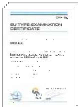
Module B certificaat IPX4