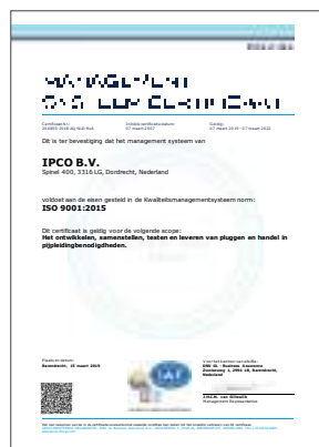
ISO 9001 certificaat