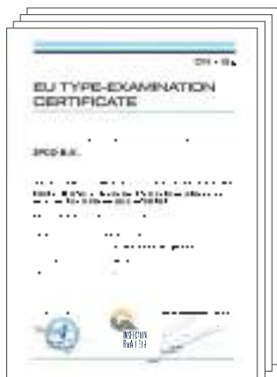
Module B certificaat IPX4