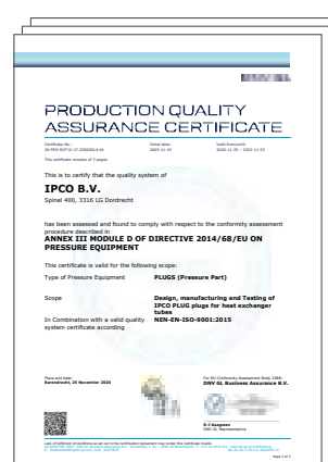
Module D conformiteit Pluggen